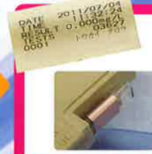
測定チケットに表示とともに、USBにもデータを保存。