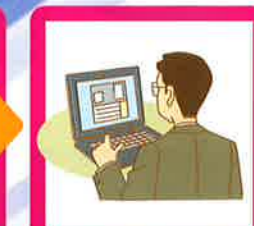
USBのデータをエクセルで管理できます。